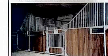
Pferdeboxen mit Schiebe- oder Drehtür in Exklusiv- oder Standardausführung nach Ihren Maßen und Wünschen