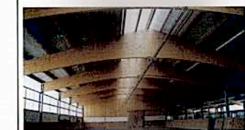
Reithallen mit Leimholzbinder, isoliertem Dach und breitem Licht- und Lüftungsrast