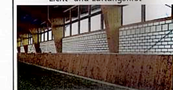
Reithallenbände mit Betonsockel